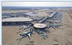
【成田空港制限区域】 制限エリアの視察