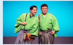
【よしもと幕張イオンモール劇場】 お笑いライブの作り方