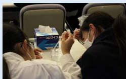
【かずさDNA研究所】 DNA抽出実験