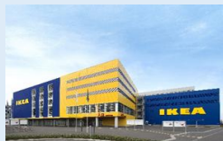
【IKEA 東京ベイ】 サステナビリティの取組み