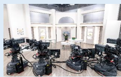
【QVCジャパン】 スタジオ見学&社屋視察