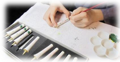
オリジナルの和ろうそくを作ってみよう！

各期ごとに、ご利用いただける学校を決定し、ご利用可否、時間等をご連絡いたします。 なお、予定の範囲を超えるお申し込みがあった場合等は抽選とします。