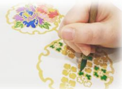
ランチバックorトートバック（※素材は現地で選択）を手描友禅の技法で染めてみよう！