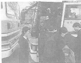
修学旅行は、将来のよい旅人づくりのために、奈良交通株式会社が取り組んでいます。