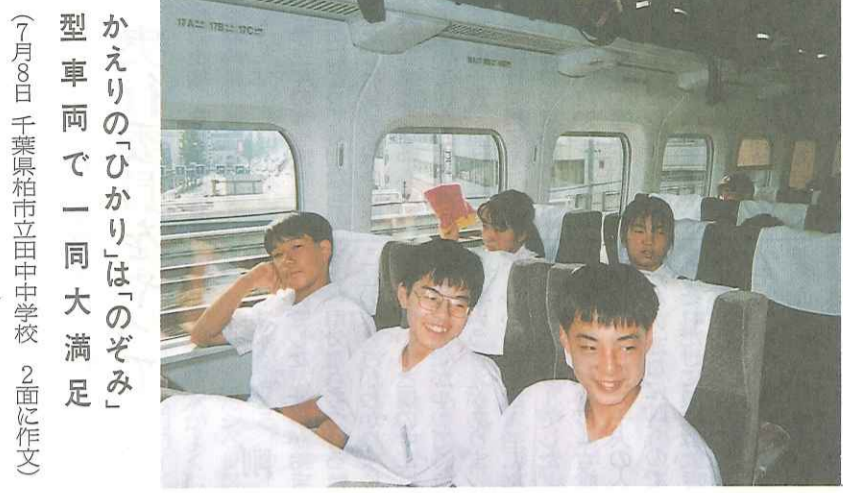
かえりの「ひかり」は「のぞみ」型車両で一同大満足 (7月8日千葉県柏市立田中学校 2面に作文)