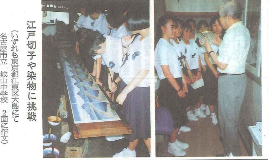
江戸切子や染物に挑戦