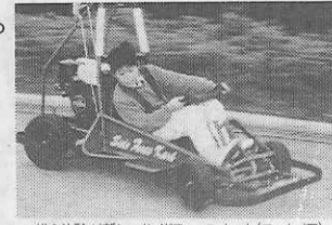
▲横G体験が新しいサイドフォースカート(モートA)

体験学習のご案内 ●エンジン教室●本田技研鈴鹿製作所工場見学 ●モトピア●モータースポーツ観戦●地曳綱 ●潮干狩り●伊勢形紙彫り●茶摘み●テーブルマナー 他 お問い合わせ・お申し込みは 鈴鹿サーキット 〒510-02 三重県鈴鹿市福生町7992 ☎(0593)78-1111 〒107 東京都港区赤坂2-17-22 東京営業所 〒562-01 大阪府吹上区吹上16番 ☎(03)3582-3221